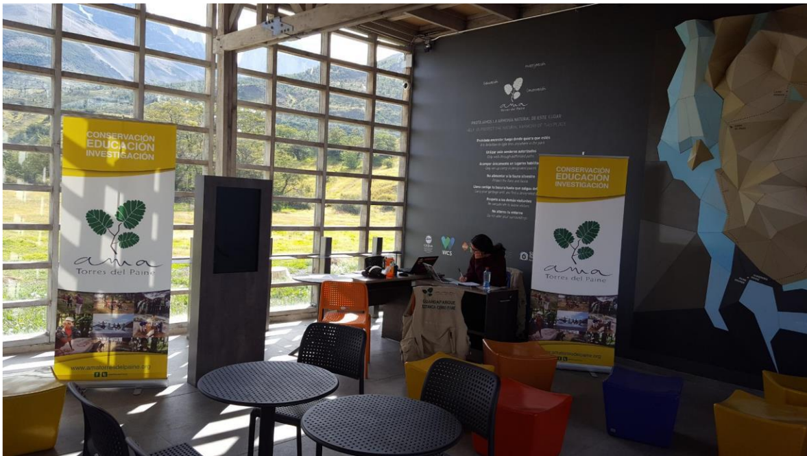
Imagen del Centro de Bienvenida. Las ubicaciones varían según la restructuración de la temporada.

En cuanto a las rutinas del voluntario se considera un desayuno entre las 8:00 am y 9:00 am, almuerzo entre las 12:30 pm a 14:00 y cena entre las 19:30 y 20:30 horas.